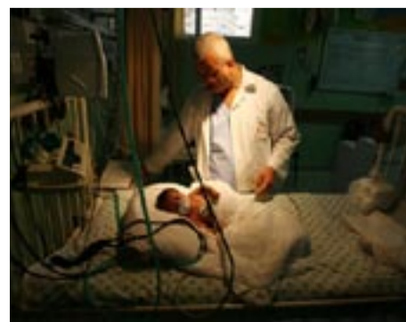
Τά νοσοκομεία πλήττονται πρῶτα ἀπό τόν γκαγκωτικό αποκλεισμό τῶν σιωνιστῶν

Σταματήστε τώρα τόν αποκλεισμό τῆς Γάζας! Λευτεριά τώρα στην Παλαιστίνη!