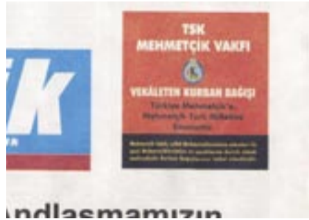
Νά κι ἕνα δείγμα εὐγνωμοσύνης: Ἡ τοπική «Μπιρλικ» ζητᾶ πρωτοσέλιδα προσφορές στό Ἴδρυμα του... τουρκικοῦ Στρατοῦ

σαφῶς, ή... ἄλλη πλευρά! Διαβάζουμε στή «Γκιουντέμ» (14/12/07) φράση τού Ι. Σερήφ : «Ὅπως γνωρίζετε καί στήν Κωνσταντινούπολη ὑπάρχει Ἑλληνική μειονότητα καί αὐτή ή μειονότητα ἔχει βακούφια. Μάθαμε στίς ἐπαφές πού εἴχαμε μέσω τού πρώην βουλευτή Ἰλχάν Αχμέτ ὅτι βγήκαν καινούργιοι νόμοι καί βελτιώθηκε ή κατάσταση τῶν βακουφίων ἐκεῖ» (εἶδατε ὅτι τελικά κάτι μαθαίνουν γιά τὰ πέραν τού Ἐβρου τεκταινόμενα; Παλιά ὄ,τι καί νά τούς ρωτοῦσες δήλωναν